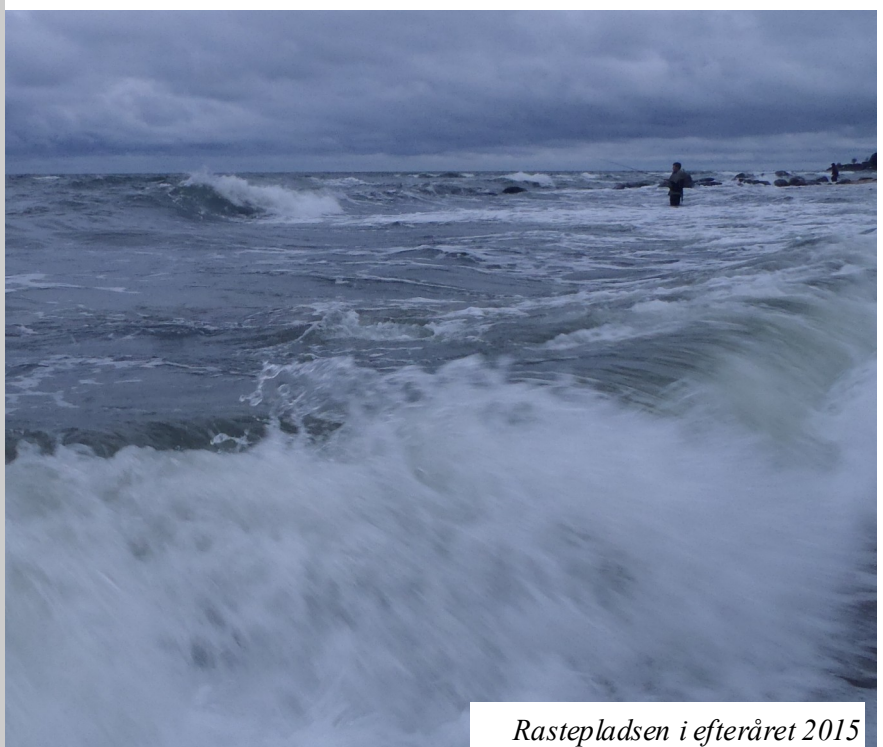
Rasteplassen i efteråret 2015