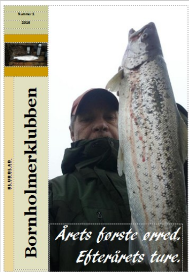
Forside foto: Slagterørred